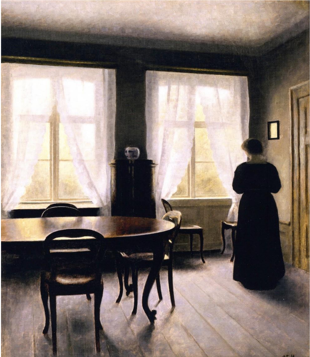
Vilhelm Hammershøi - Interior, Frederiksberg alle - 1900