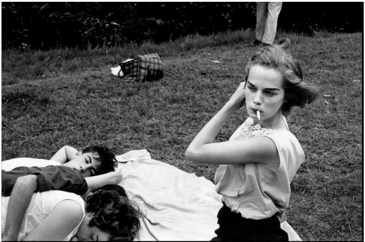
USA. New York City. 1959. Brooklyn Gang. Bruce Davidson

Un texte théâtral bref (2500 mots maximum), pour 2 à 4 comédien.ne.s, librement inspiré de la photographie ci-dessous :