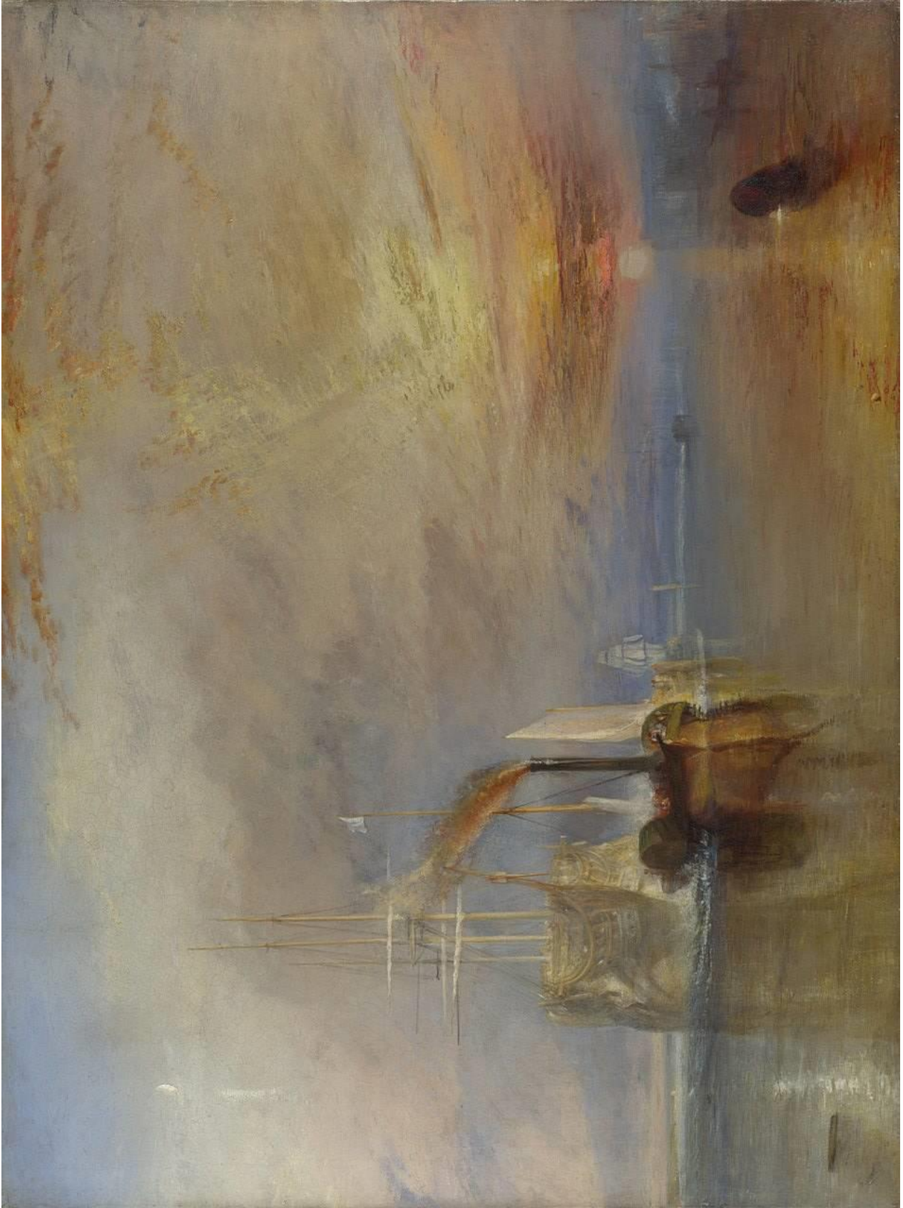
1. Vous analyserez la composition et le traitement de la lumière dans cette toile de Turner : The Fighting Temeraire