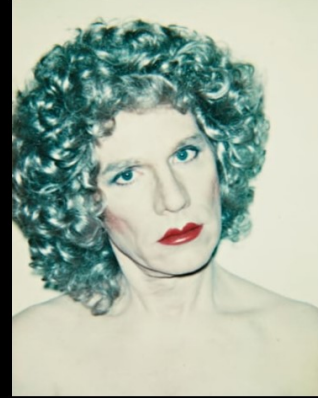
Self-portraits in Drag, 1981-1982