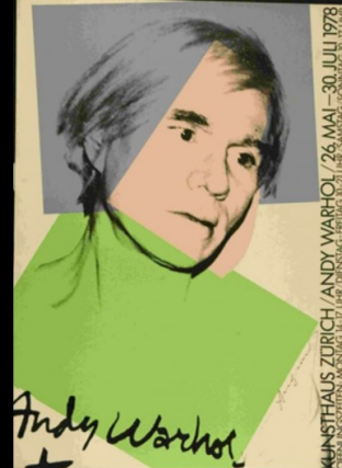
Self-portrait (in Interview T-Shirt), 1977-1978