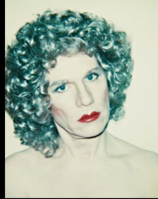
Self-portraits in Drag, 1981-1982