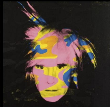
Camouflage Self-Portrait, 1986